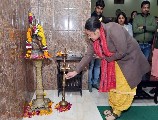
LAMP LIGHTENING CEREMONY