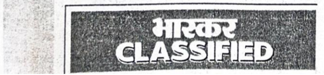
AMAR UJALA 03.02.2024