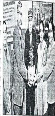
मुख्य अंश को घेरा धरें कर्ना प्रचार्य टारक रोजगार के लिये