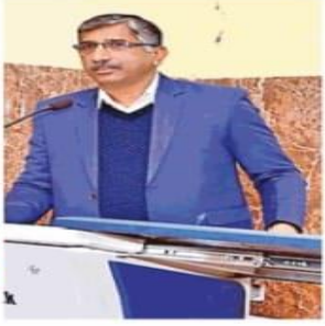
कार्यशाला में छात्राओं को संबोधित करते मुख्य वक्ता।